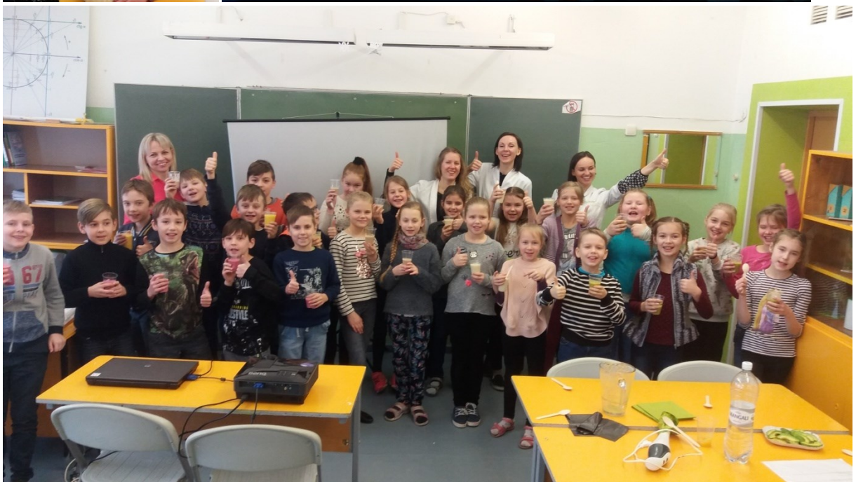
3.a klases skolēniem nodarbība ir radījusi dzīvesprieku, kas arī ir pareiza uztura stūrakmens.