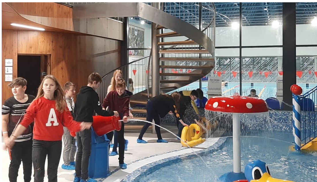
6.c klases skolēni apskata ūdens atpūtas zonu, baseinus, slidotavu, iepazīstas ar tur strādājošo profesijām un ikdienas pienākumiem.