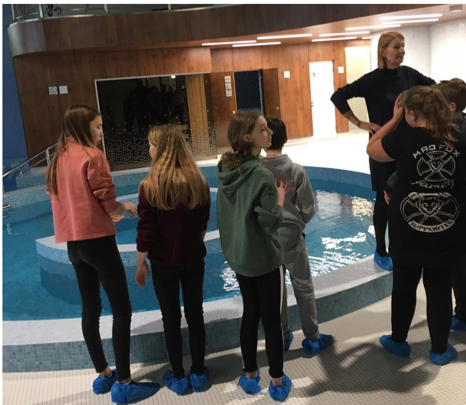
6.d klases skolēni apskata ūdens atpūtas zonu, baseinus, slidotavu, iepazīstas ar tur strādājošo profesijām un ikdienas pienākumiem.