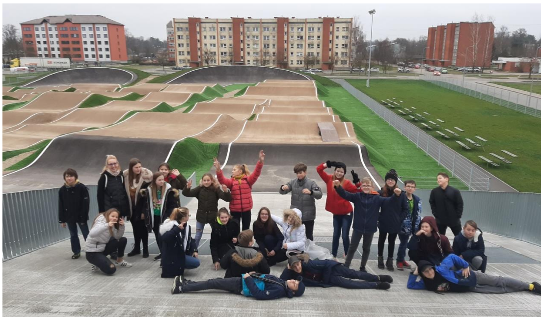
6.c klases skolēni Vidzemes Olimpiskajā centrā pie BMX trases