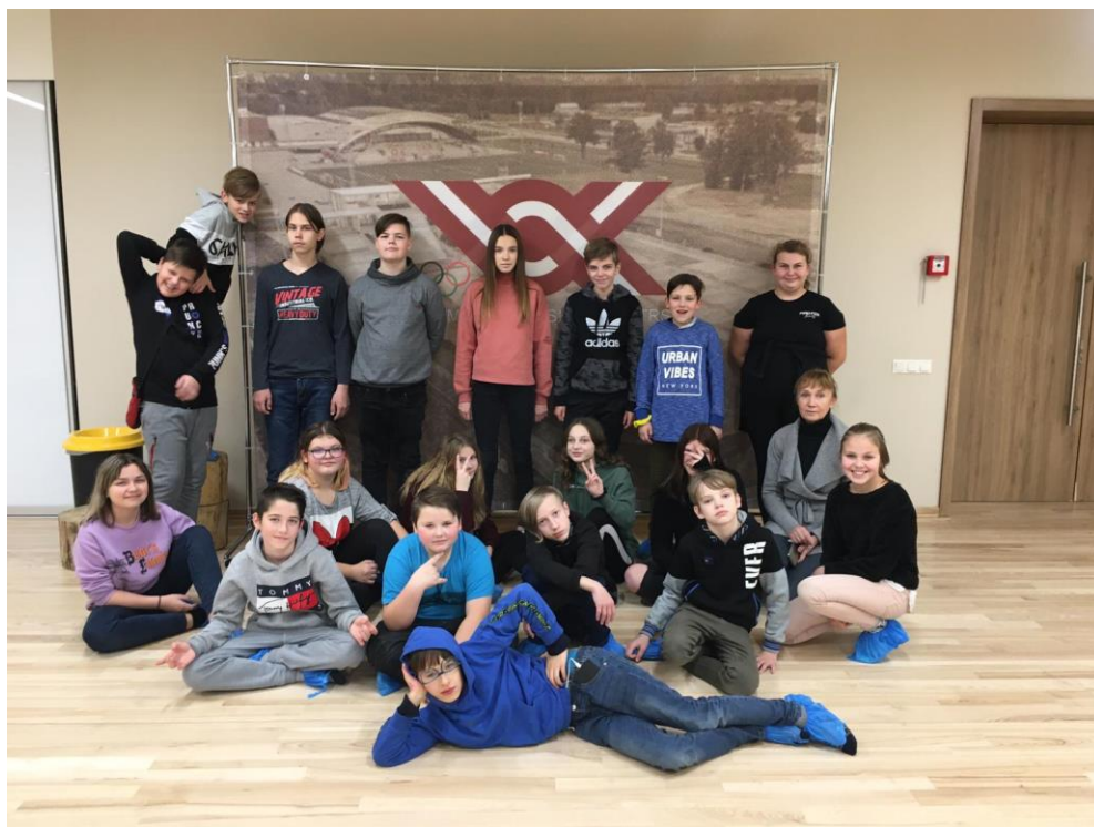
6.d klases skolēni Vidzemes Olimpiskajā centrā un pie BMX trases