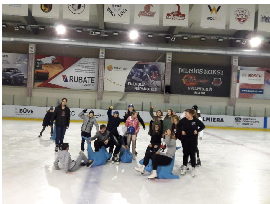
Eiropas Savienību fondu darbības programmas "Izaugsmes un nodarbinātība" 8.3.5. specifiskā atbalsta mērķa "Uzlabot pieeju karjeras atbalstam izglītojamajiem vispārējās un profesionālās izglītības iestādēs" projekts Nr.8.3.5.0/16/1/001 "Karjeras atbalsts vispārējās un profesionālās izglītības iestādēs"