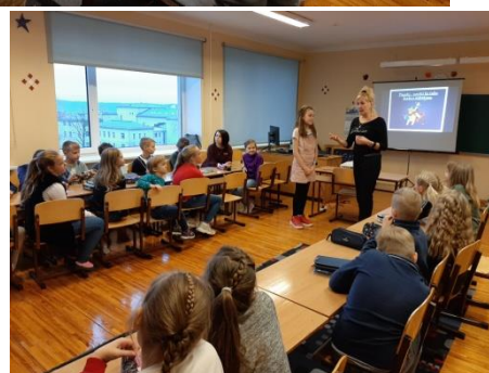
Mirkļi no 3.c klases nodarbības.

Kā noslēdzošā aktivitāte bija spēle " Pozitīvo emociju tunelītis ". Tā ļāva bērniem pašiem radīt un izdarīt pasūtījumu (vēlēšanās formā) un rast iespēju piedzīvot, ka pasūtījums (vēlēšanās) piepildās. Pastarpināti bērniem, pārvarot grūtības un izdarot ko jaunu, cēlās pašapziņa, kā arī tika gūtas pozitīvas emocijas.