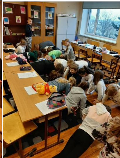
3.a klase čakli darbojas.