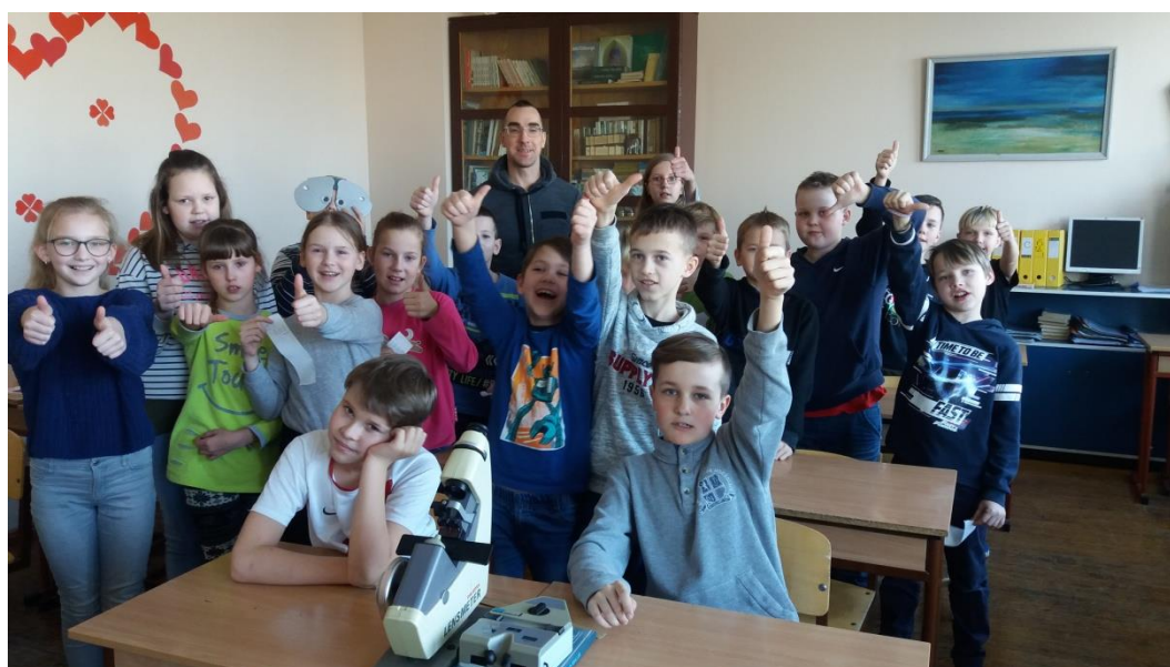
4.e klases skolēni vērtē nodarbību.