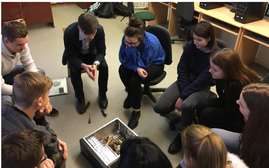
Skolēni iepazīstas ar dažu ierīču bojājumu izpausmēm.