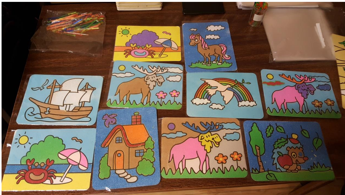
5.klases skolēnu radītie darbi smilšu aplikācijas tehnikā.