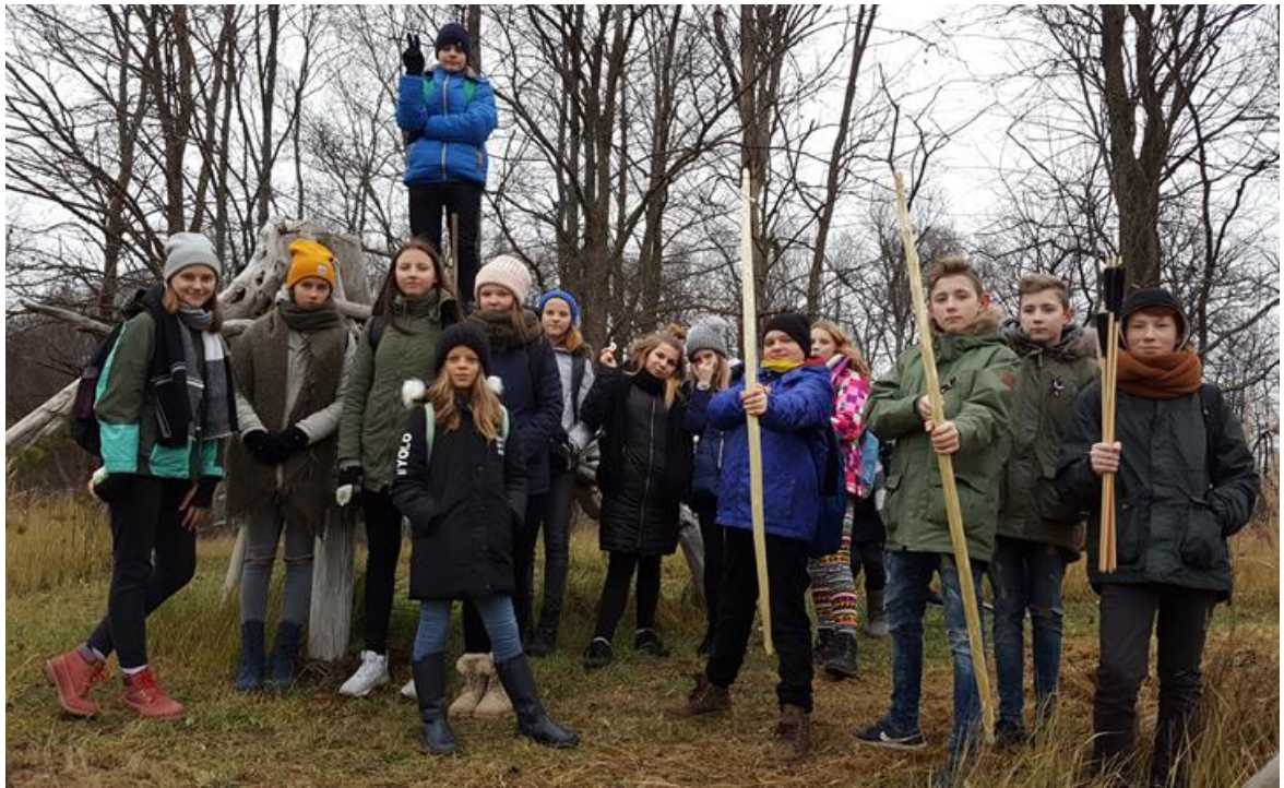
7.b klase ir viena MILŽĪGA VIENOTA komanda