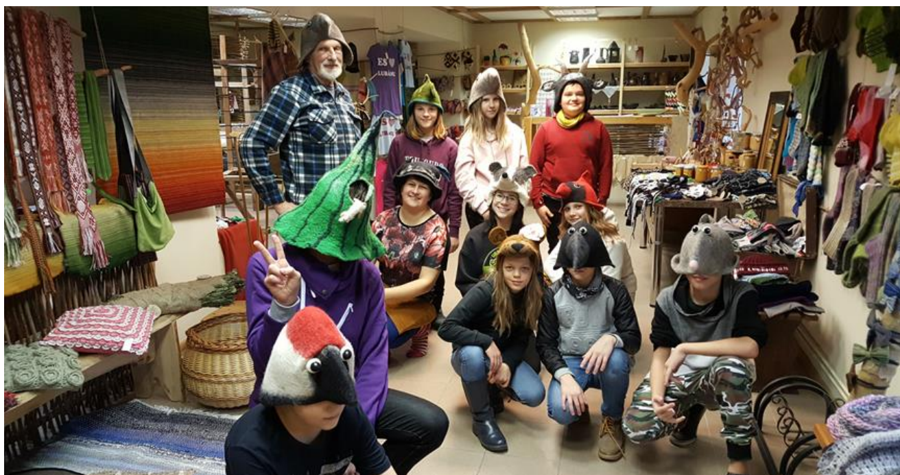
Kopīgs foto ar amatniekiem un filcētām cepurēm – maskām.